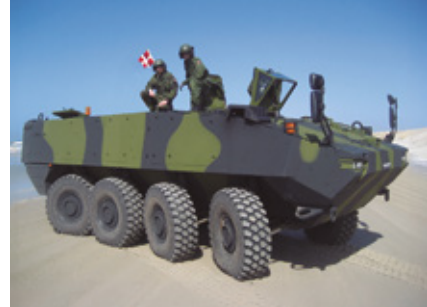
Danmark var den første kunde til PIRANHA 5 – der introducerede den seneste generation af den vestlige verdens mest succesrige pansermandskabsvogns familie.

Professionel logistisk support og pålidelig levering af reservedele er en integreret del af GDELS-koncept. Det tætte samarbejde med det danske forsvar har gjort Danmark til endnu et af GDELS' „hjemlande“, udover sine traditionelle produktionsfaciliteter i Spanien, Schweiz, Tyskland og Østrig. En del af denne succeshistorie er det betroede partnerskab med den lokale industri. GDELS har identificeret samarbejds muligheder med lokale nøglepartnere, som bidrager til væsentlige danske sikkerhedsinteresser. I dag omfatter det danske PIRANHA 5 underleverandørsteam otte hovedpartnere og mange mindre langs forsyningskæden. Dette sikrer ikke kun en hurtig reaktion på ethvert af den danske hærs behov, men giver også varige fordele for den lokale industri. I stedet for projektspecifik blueprintproduktion forfølger GDELS sin langsigtede industrielle vækststrategi med eksportmuligheder for den lokale industri og skaber dermed også nye jobmuligheder i et langsigtet perspektiv. Ud over den løbende logistiske støtte er der nye projekter i horisonten. Tidligere i år blev det besluttet at anskaffe en luftforsvarsvariant af PIRANHA 5. Forsynet med SKYRANGER 30-tårnet vil det skærme mobile enheder mod lufttrusler – igen, PIRANHA er den rigtige platform til at få systemet derhen, hvor det er nødvendigt!