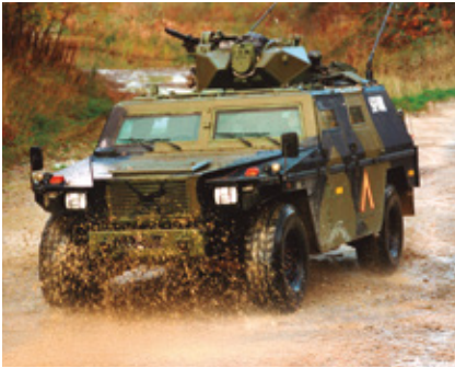
EAGLE I var det første GDELS-system der var i brug hos det danske forsvar. Den blev flittigt brugt i missioner i udlandet.

I år er General Dynamics European Land Systems (GDELS) stolte og taknemmelige over at se tilbage på tre årtiers tætte samarbejde med det danske forsvar. I 1994 startede projektet med anskaffelsen af EAGLE I. Året efter modtog Hæren sine første køretøjer under betegnelsen Spejder-vogn M/95. Det gjorde Danmark til en af de to første EAGLE-brugere. Siden dengang er i alt 670 GDELS-køretøjer af forskellige typer taget i brug hos Forsvaret.