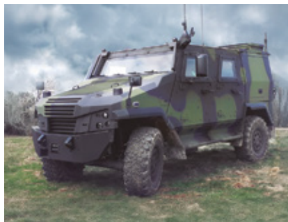
EAGLE V er den seneste tilføjelse til den danske hærs køretøjsflåde.

I 2016 blev Den Danske Hær den første kunde af PIRANHA 5. Den blev udvalgt efter et intenst internationalt sammenlignende test med fire andre konkurrenter. Her havde PIRANHA demonstreret sin overlegne mobilitet på tværs, selv i sammenligning med de tre bæltekøretøjer i konkurrencen. Med seks indledende varianter – infanteri, kommando, ambulance, ingeniør, mortar og repair – udgør køretøjet ryggraden i den dansk hærs mekaniserede styrker på hjul. Mangfoldigheden af leverede PIRANHA-varianter understreger også det meget modulopbyggede familiekoncept, som er bygget ind i alle GDELS-køretøjer. Udover deres høje beskyttelse og ydeevne er en stor fordel ved PIRANHA køretøjer samt deres interoperabilitet. Med mere end 12.000 leveret køretøjer er PIRANHA den mest udbredte pansrede mandskabsvogns familie med hjul i den vestlige verden.